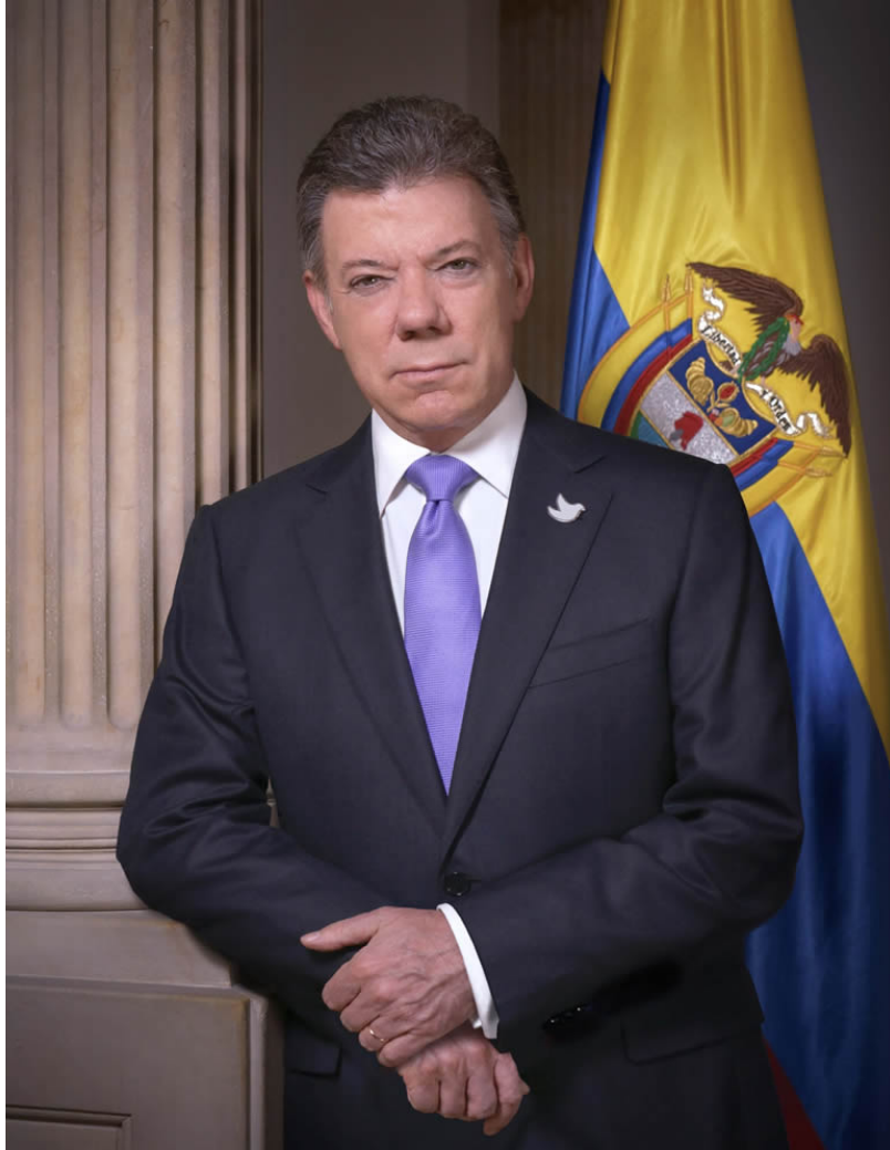
Juan Manuel Santos, Premio Nobel de Paz 2016.

“Tenemos el reto de eliminar la pobreza en todas sus dimensiones, para lograr una paz estable y duradera”