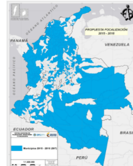
Focalización municipal de Prosperidad Social 2015-2018

Focalizar en territorio programas sociales del Estado